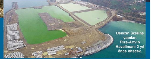
Denizin üzerine yapılan Rize-Artvin Havalimanı 2 yıl önce bitecek.

K arayolları Genel Müdürlüğünü yaptığı 9 yıllık süre içinde Türkiye'nin dört bir yanında 20 bin kilometre bölünmüş yol ile birlikte çok sayıda tüneli hizmete alan isim olan Cahit Turhan'ın Bakan olarak dönüşü mükemmel oldu.