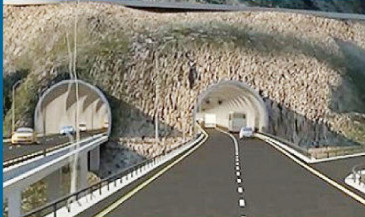
Zigana Tüneli tamamlandığında Trabzon Erzurum arası bir saat daha kısalacak.