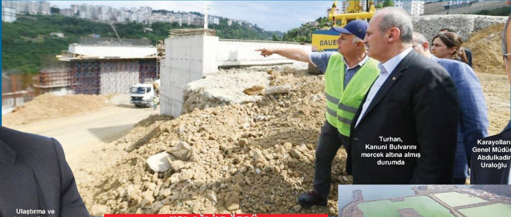
Turhan, Kanuni Bulvarını mercek altına almış durumda