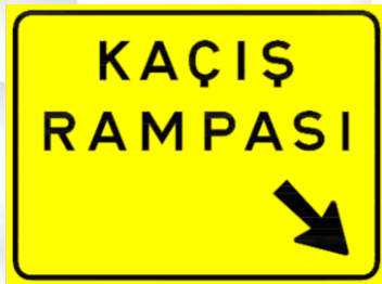
Kaçış Rampasını Gösteren İşaretler