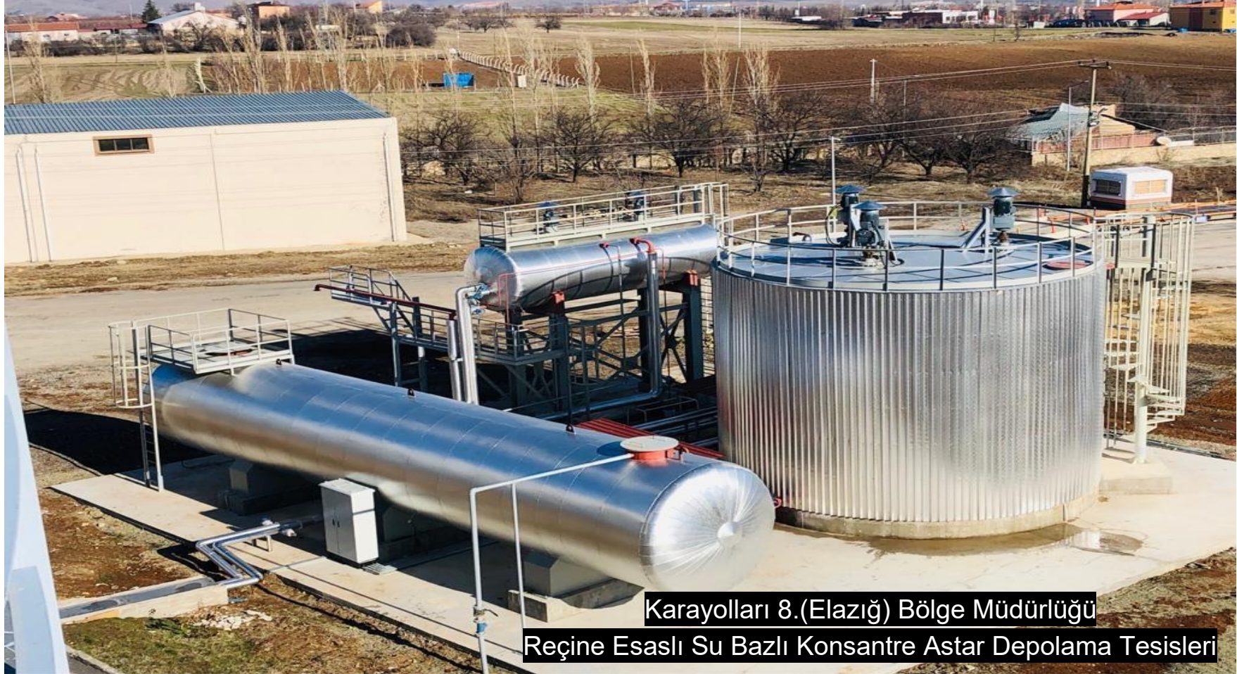
Karayolları 8.(Elazığ) Bölge Müdürlüğü Reçine Esaslı Su Bazlı Konsantre Astar Depolama Tesisleri