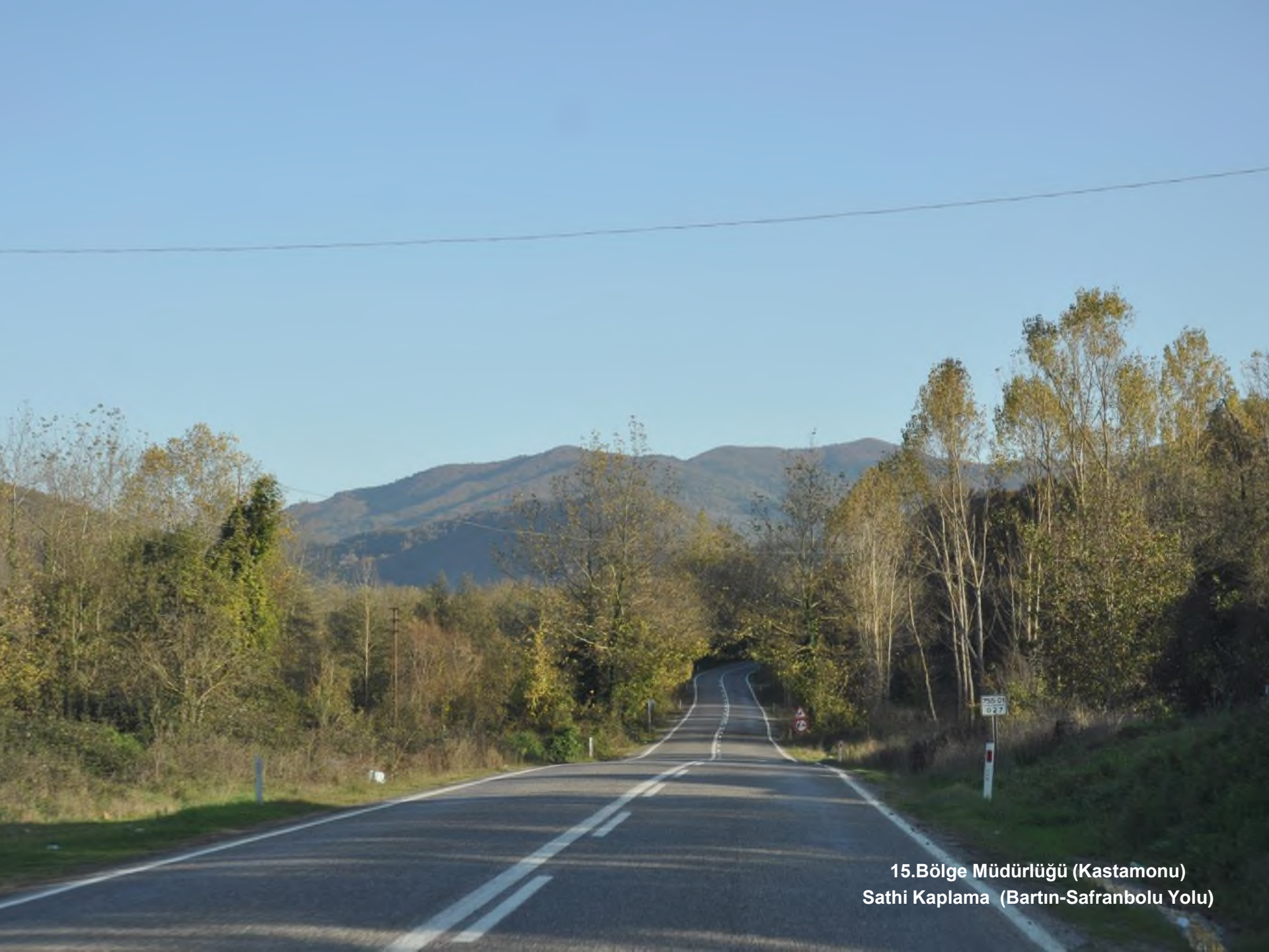
15.Bölge Müdürlüğü (Kastamonu) Sathi Kaplama (Bartın-Safranbolu Yolu)